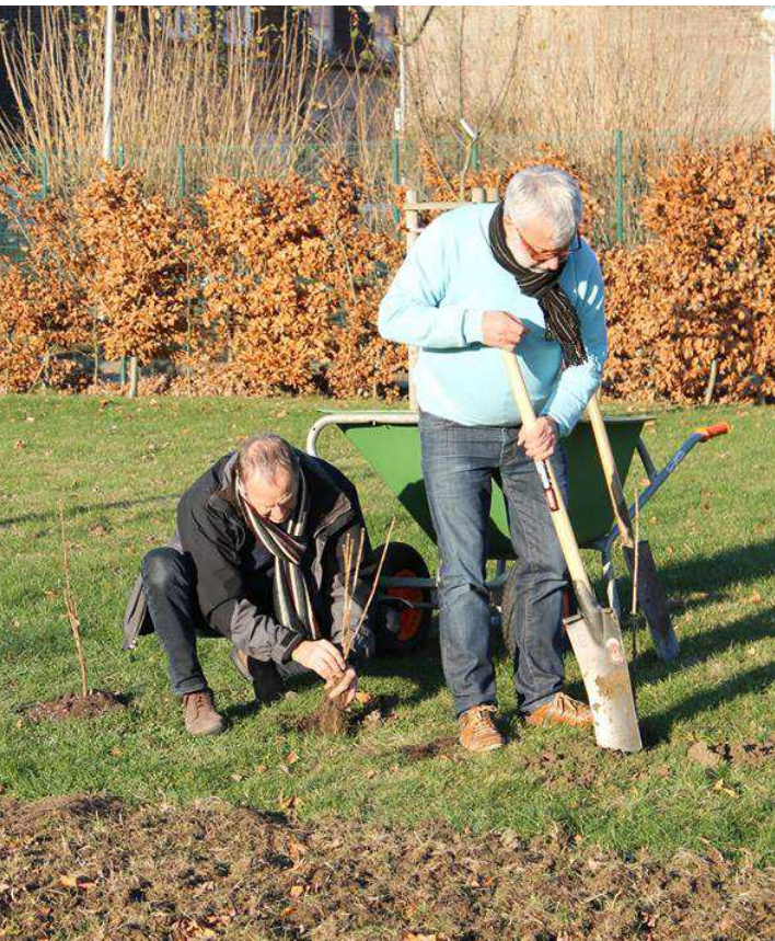
Plantation de petits fruitiers dans le jardin du Home Saint Joseph à Herseaux